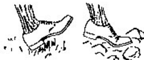
En el pasto pisa con el tacon En las piedras con los dedos

Cuando camines, apoya la punta del pie porque el golpe del talón es demasiado ruidoso. Recuerda que el silencio es una de las claves del acecho.