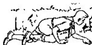
Manten baja la cabeza