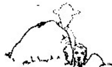
Evita recortar el fondo