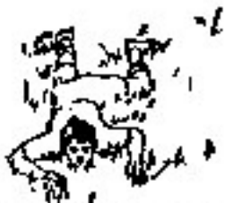
A rastras en escampado